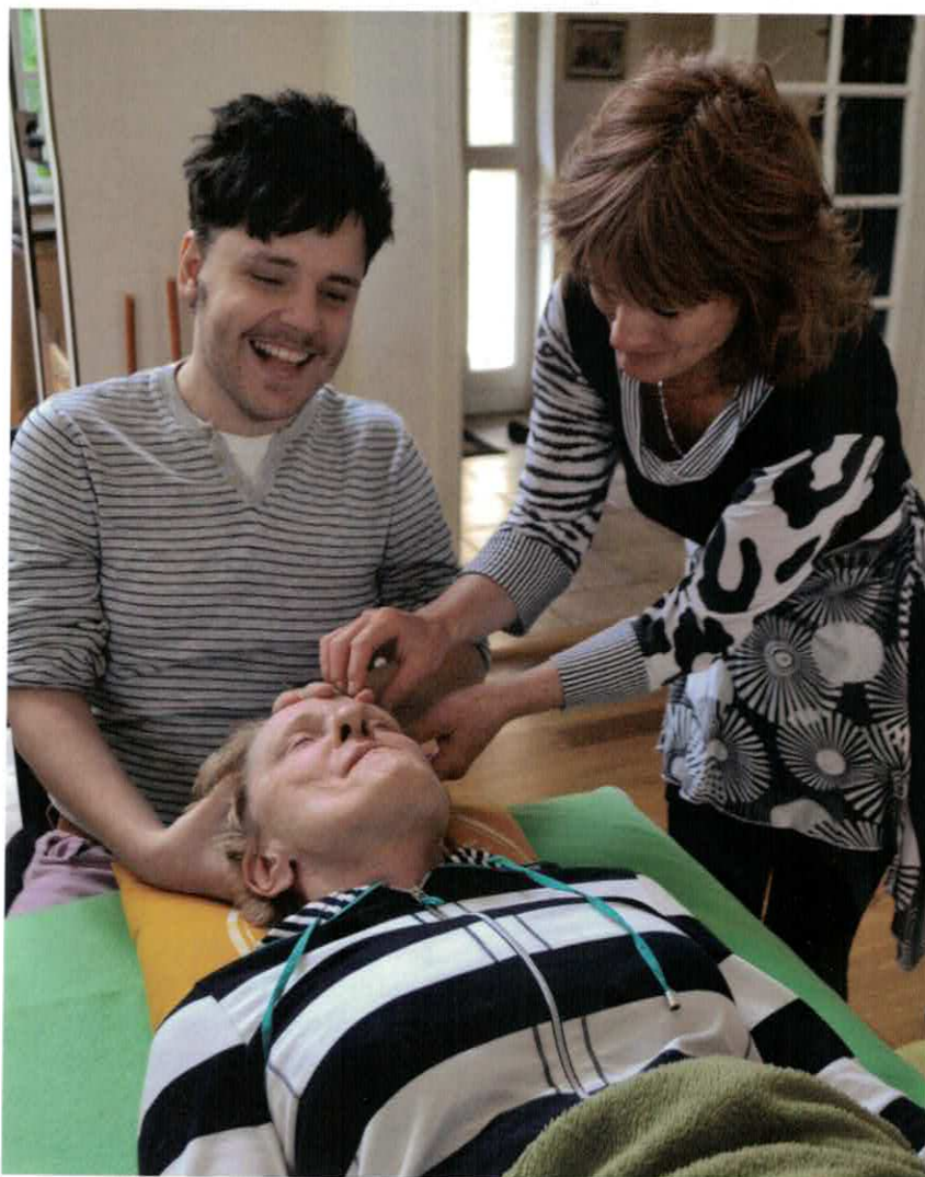
Fra en brik lyder let snorken, mens de øvrige klienter skiftevis spjætter og ler, fordi det kilder af energi.

Jeg oplevede ofte, at der var mange spørgsmål, jeg ikke kunne besvare fyldestgørende, fordi Access Consciousness rummer så mange informationer, så derfor tog jeg endnu et skridt videre og uddannede mig til Certificeret Facilitator,